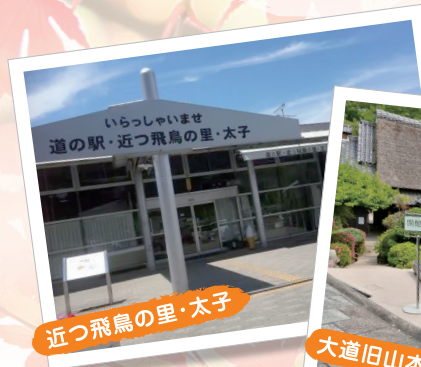
近つ飛鳥の里・太子