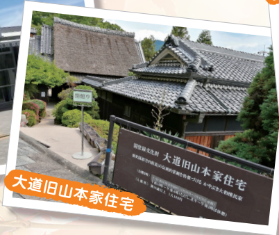
大道旧山本家住宅